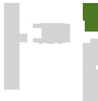
POLOHA JEDNOTKY V RÁMCI PODLAŽÍ

Pozn.: Sklep je v ceně jednotky. Součástí jednotky není kuchyňská linka, interiérové vybavení a svítidla.